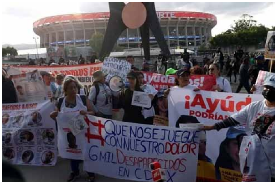
Madres Buscadoras protestaron en contra de las desapariciones y del Mundial en la reinauguración del Estadio Azteca el 28 de Marzo.

Protestas como la convocada por el Frente Antigentrificación y activistas el 4 Julio de 2025, lograron visibilizar la gravedad de esta problemática y violencia que las inmobiliarias y grandes capitales agravan en su ambición por hacer del derecho a la vivienda una mercancía más para aumentar sus ganancias. Ahora con la coyuntura del Mundial, los desalojos (como los de la Calle República de Cuba, en el Centro Histórico, el pasado 28 de noviembre) y aumentos de precios de renta a habitantes de los barrios obreros se intensifican. Por ejemplo, el precio promedio de un departamento de dos habitaciones y